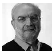
■ Benigno Calvi Sindaco

C on questo numero riprende la pubblicazione del notiziario ufficiale del nostro Comune. Lo troverete certamente un po' diverso dai precedenti nella composizione della redazione, cui do il benvenuto, nel titolo e nella forma, certamente più sobria, poiché si è voluto privilegiare soprattutto lo spazio per i contenuti.